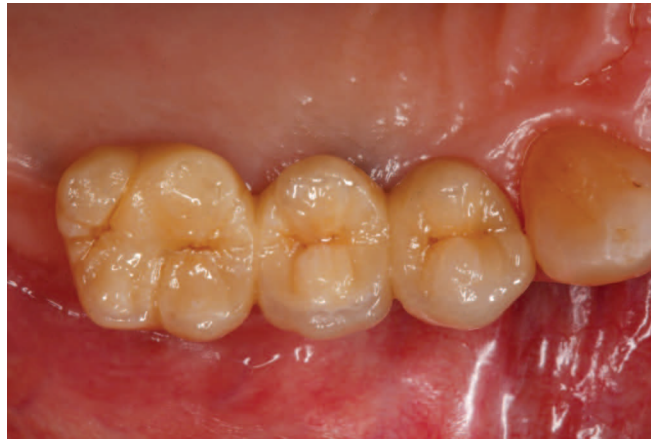
Fig. 6 La modalità "Mirror" permette di riflettere automaticamente l'immagine, così si ottiene sempre la rappresentazione nel verso giusto, anche se si utilizza uno specchio