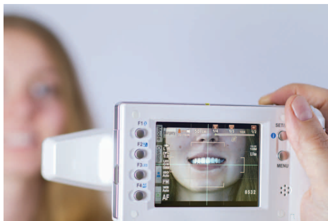
Fig. 2 Il peso limitato, la funzione di autofocus precisa e un programma di stabilizzazione ottica permettono di utilizzare EyeSpecial C-III con una sola mano