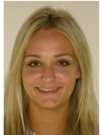
Fig. 7 Esempio di una foto ritratto con EyeSpecial C-III senza alcun dispositivo ausiliario

I primi due programmi, "Standard" e "Surgery", sono indicati per le classiche fotografie frontali: la differenza risiede nella distanza di scatto selezionata. La modalità Standard è adatta per fotografie frontali (senza specchio), per la documentazione di casi clinici e come supporto diagnostico (Fig. 4).