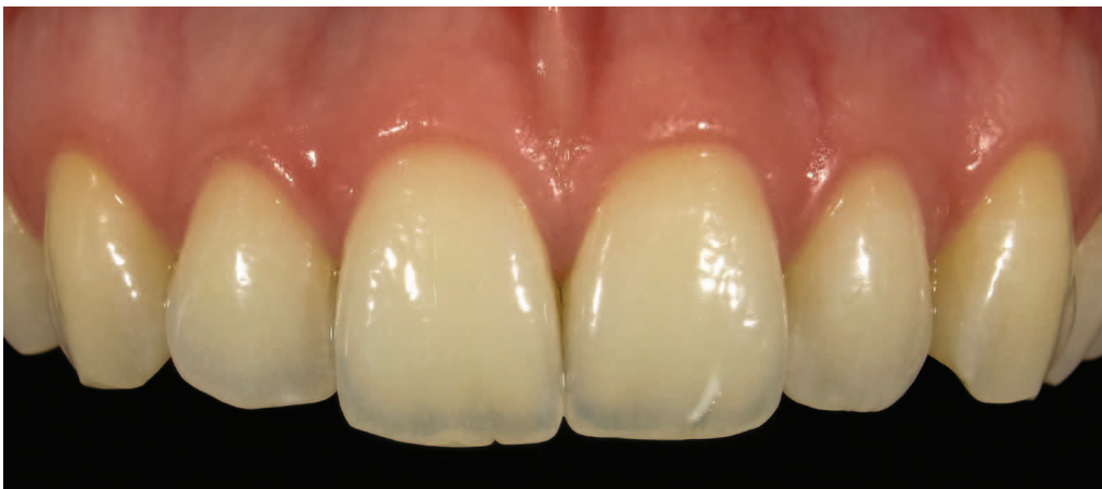
Fig. 9 Nella modalità "Low Glare" con un controllo specifico della luce si minimizzano i riflessi e migliora la valutazione della morfologia superficiale e delle traslucenze incisali

di una foto ritratto. Con il cellulare però si ottiene una qualità sufficiente nei ritratti solo con una perfetta illuminazione diffusa. Queste condizioni di luminosità non si trovano dappertutto e in ogni momento del giorno. Inoltre la funzione di flash interno nei dispositivi dei cellulari causa la formazione di ombre. Risulta quindi limitato l'utilizzo di queste foto.