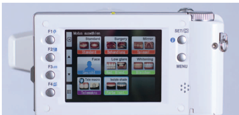
Fig. 3 La fotocamera dentale EyeSpecial C-III offre un concetto di funzionamento intuitivo con 8 programmi specifici per l'utilizzo dentale

EyeSpecial C-III. Questa fotocamera compatta da 12 megapixel è dotata di un obiettivo zoom-macro con una distanza focale da 28 a 300 mm (convertita per la fotografia di formato ridotto) e di un sistema d'illuminazione fisso, che comprende 4 LED vicini all'obiettivo e 4 flash laterali (Fig. 1). I flash interni e i flash laterali inclinati di 45° possono venire comandati separatamente a seconda della situazione da fotografare. EyeSpecial C-III presenta quindi un sistema di flash integrato, che assicura un'ottimale illuminazione per la maggior parte delle fotografie dentali. I flash laterali esterni garantiscono nelle fotografie degli anteriori una rappresentazione molto plastica, mentre i flash interni assicurano un'illuminazione ottimale nella fotografia intraorale con lo specchio. A seconda