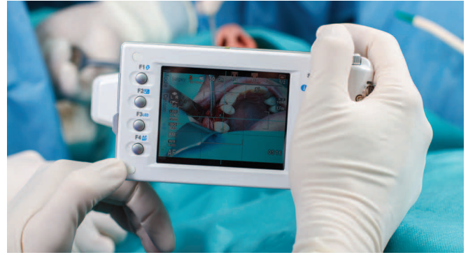
Fig. 5 Le fotografie in modalità "Surgery" possono essere scattate con una distanza maggiore dal soggetto, cosa molto interessante per la documentazione intraoperatoria