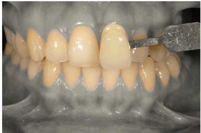
Fig. 8 La modalità "Isolate Shade" crea due immagini, che sono indicate soprattutto per la comunicazione del colore, poiché la mascheratura dei tessuti molli permette una valutazione precisa delle differenze cromatiche rispetto al campione della scala colori fotografato insieme