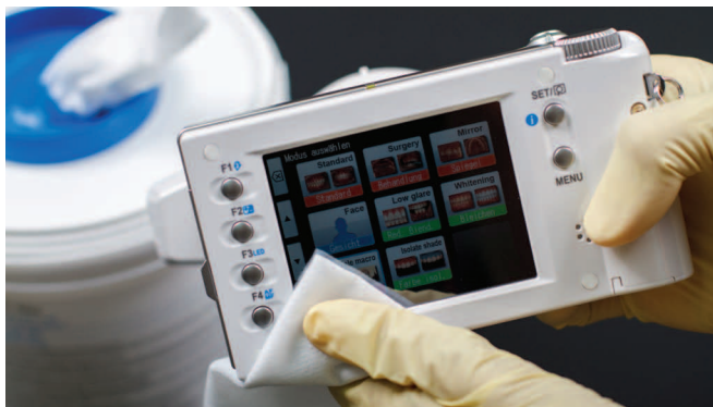
Fig. 11 La struttura compatta e a tenuta stagna permette una disinfezione semplice e sicura di EyeSpecial-C-III

liscia e il corpo macchina è a tenuta stagna. Può così essere disinfettata facilmente utilizzando i disinfettanti in commercio a base di etanolo (Fig. 11). Una serie di funzioni per l'elaborazione delle immagini e la possibilità di aggiungere alle foto il numero di identificazione o il nome del paziente completano le caratteristiche interessanti di EyeSpecial C-III. Questa possibilità di classificare le immagini semplifica l'invio e quindi anche la collaborazione con il laboratorio. Lo specifico software di gestione delle immagini SureFile (Shofu Dental), che può essere scaricato gratuitamente in Internet, permette inoltre di creare un proprio archivio fotografico. Ovviamente l'utilizzatore esperto può anche eseguire impostazioni manuali delle funzioni della fotocamera e correzioni delle impostazioni automatiche d'esposizione. Questo può essere utile soprattutto per foto ritratto su sfondo nero o bianco. È possibile escludere anche la funzione di autofocus della fotocamera: in questo caso la nitidezza dell'immagine viene imposta dal movimento della fotocamera