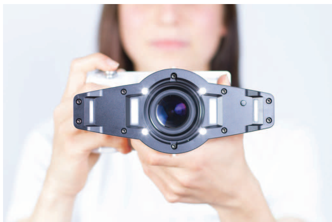
Fig. 1 Le 4 luci LED e i 4 flash laterali permettono un'ottimale illuminazione di tutte le situazioni che si presentano nella fotografia dentale