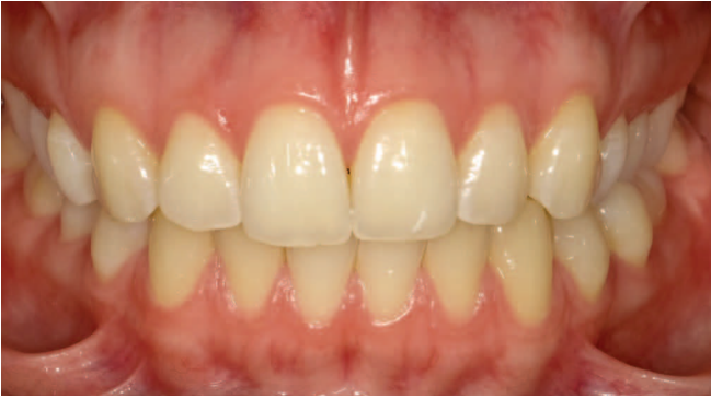
Fig. 4 Documentazione della situazione iniziale con la modalità Standard